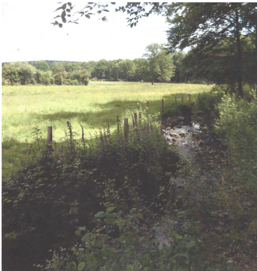
▲ Ruisseau de Roche-Elie