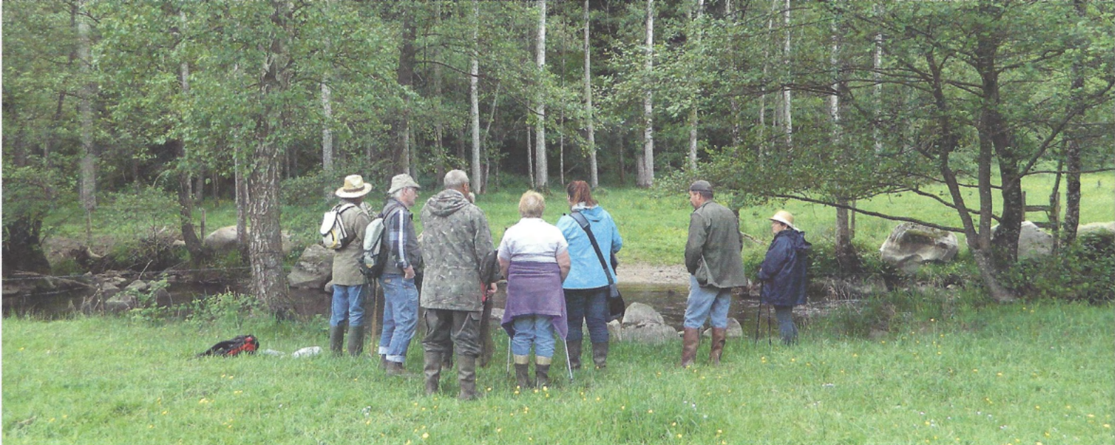
▲ Animation grand public sur le Sarthon