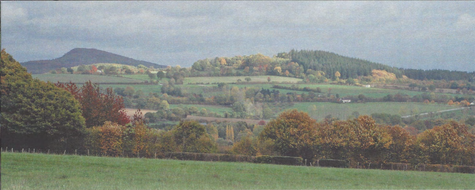
▲ Butte Chaumont et bois de Beauchêne depuis Gandelain