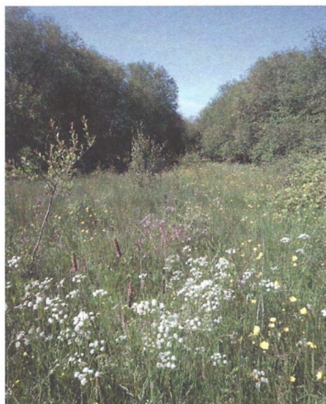
▲ Prairie humide