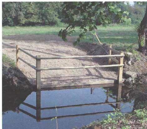
▲ Descente aménagée