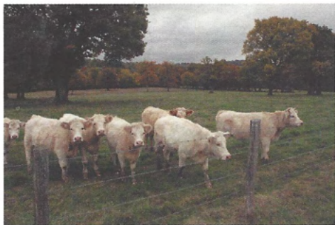
▲ Pâturage bovin