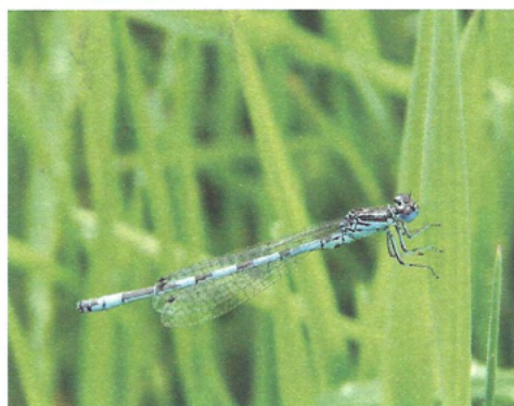
▲ Agrion de Mercure